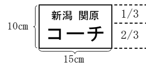
《例3》【コーチの胸ゼッケン】