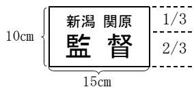
《例2》【監督の胸ゼッケン】